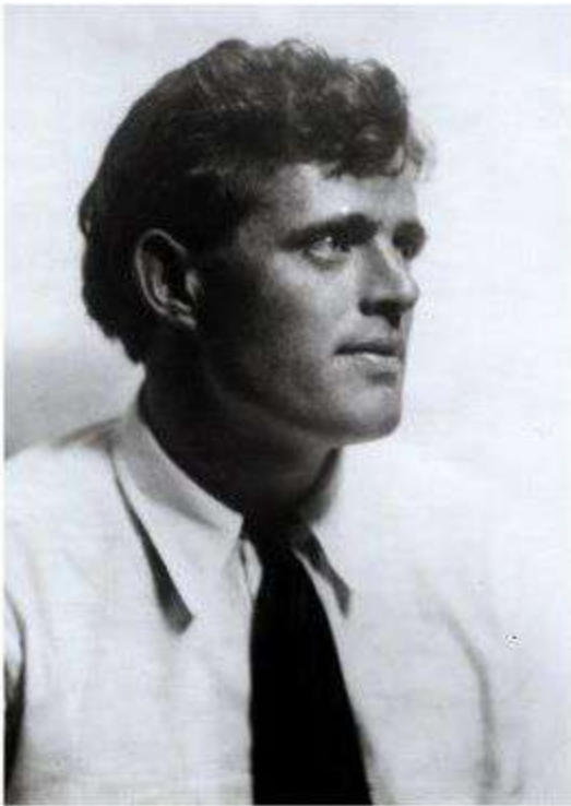
Jack London (1876-1916)

Những danh nhân mà thiếu thời phải làm những nghề mà hồi xưa cho là ti tiện, thì ta thường thấy: Abraham Lincoln đốn củi, cày ruộng, chăn bò chó các chủ trại; Heinrich Schliemann đóng rượu, cân cá, đếm khoai cho các tiệm tạp hoá; Quản Trọng làm chú bán dầu; J.J. Rousseau làm đầy tớ cho