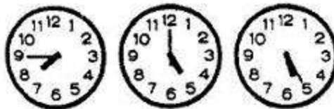
Đồng hồ sai (tiếp theo)