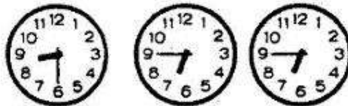
Đồng hồ đúng