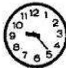
Lúc đồng hồ ngược bắt đầu chạy lùi