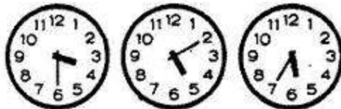
Đồng hồ sai