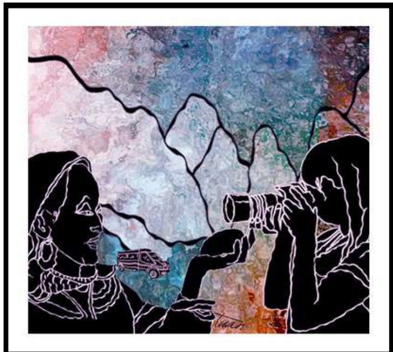
Minh họa: Mạc Tuấn

Sẵn chắc, bò mài áo phong, giày lười không tất, khoác túi máy ảnh “như chuyên nghiệp”, Nhị khiến Hằng bay hăn ấn tượng “cán bộ vùng cao”. Bèn dấm dẫn khen lại: “Anh sành điệu thật đấy, chỉ thiếu vài lỗ thủng ở quần và quả đầu trọc. Mà đi họp huyện cũng thế này á?”.