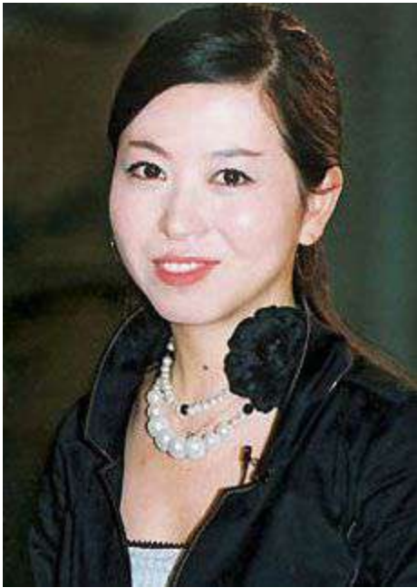
Nữ sĩ Vệ Tuệ