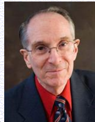
Lewis Terman mô ước về một xã hội lý tưởng trọng dụng nhân tài

Một trong số những “lời đề nghị hết sức khiếm nhã” của Shockley thời đó đối với Chính phủ Mỹ là chính phủ nên trả một khoản tiền bồi thường nào đó cho những người có IQ thấp, đổi lại những người này sẽ triệt sản vĩnh viễn, khước từ quyền có con nối dõi. Ông đề nghị khoản tiền đó tính như sau: nếu IQ trung bình là 100, những người trí tuệ kém phát triển sẽ có IQ nhỏ hơn 100, và số tiền bồi thường cho họ sẽ là (100 - \text{giá trị IQ của họ}) \times 1.000 \text{ USD} ! Sau đó ông lại nhận thấy rằng đối với những người thiếu não thật sự thì phép tính này là rất khó hiểu, vậy lại phải đưa thêm ra một phần thưởng đặc biệt kèm theo dành cho những người có công thuyết phục họ đi triệt sản.