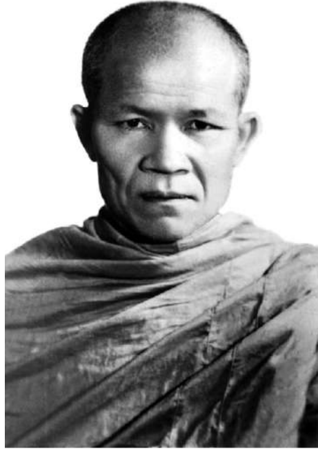
Ngài Ācariya Mahā Boowa Ñāṇasampanno (1913 - 2011)