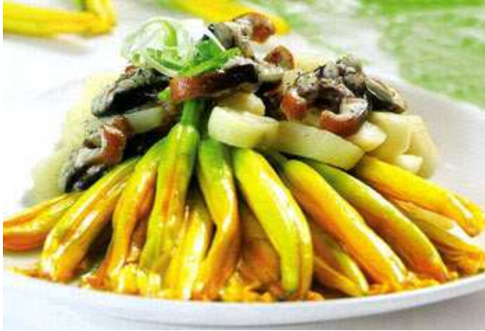
Món kim chi xào lươn