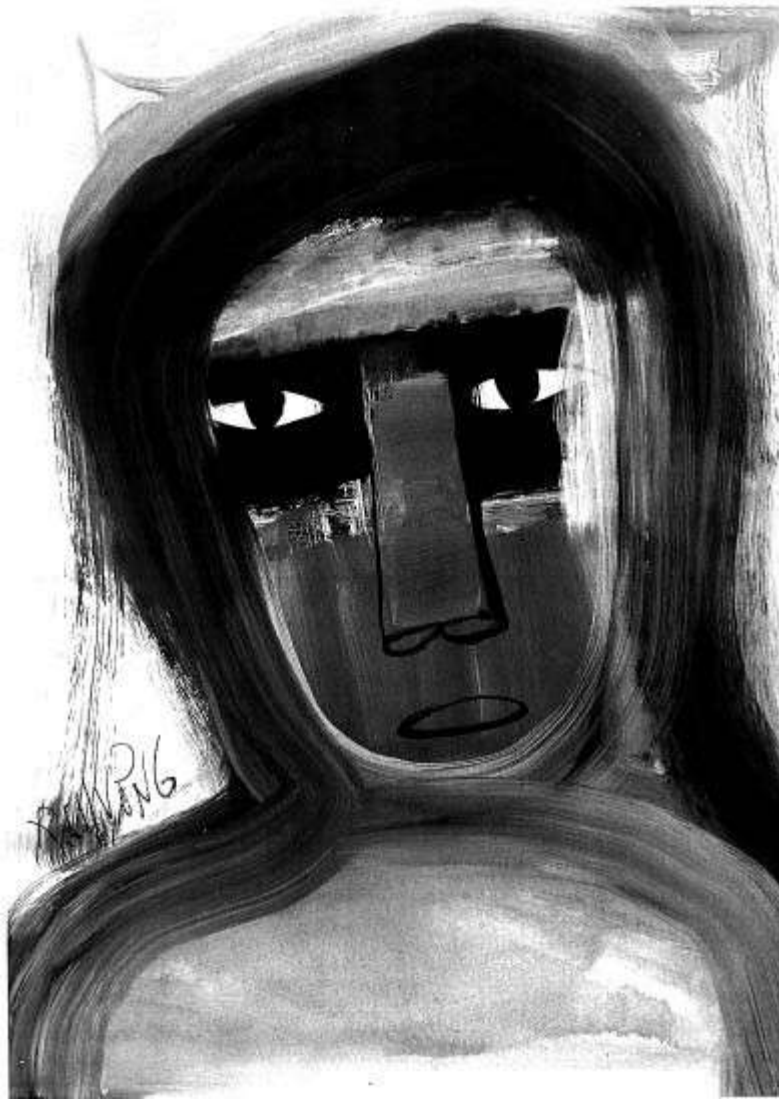
Minh họa: Thành Chương