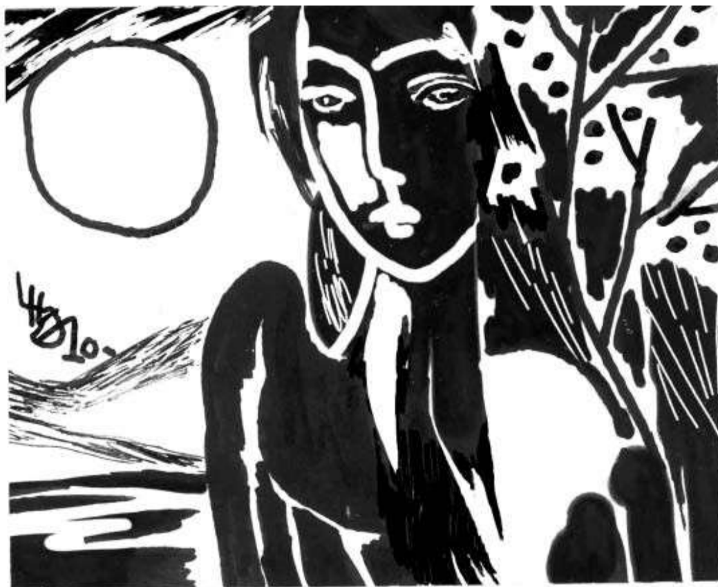
Minh họa: Lê Huy Quang

nhẹ bảo, rằng chị cứ ngộ`i nguyên đấ`y, để anh xem xét sao đã. Rô`i anh nhoẻn cười, hỏi chị có sợ không? Nụ cười làm cho chị thấ`y nhẹ lòng, nỗi sợ bay biế`n. Chị đáp, thực lòng thì có sợ, nhưng có anh bên cạnh chị không còn sợ nữa. Anh lại cười, cười thật tươi. Chị cũng cười. Anh bảo, nếu em giúp anh thì không gì không vượt qua. Anh mở cốp xe lấ`y ra một hộp các-tông trong đó có một chiế`c rìu, một lưỡi xẻng. Anh dặn chị, ngộ`i trong xe đợi anh, rô`i chạy tấ`t qua quãng đờ`ng đế`n ngọn đờ`i bên cạnh, lấ`p ló má`y ngôi nhà sau lũy tre xanh.