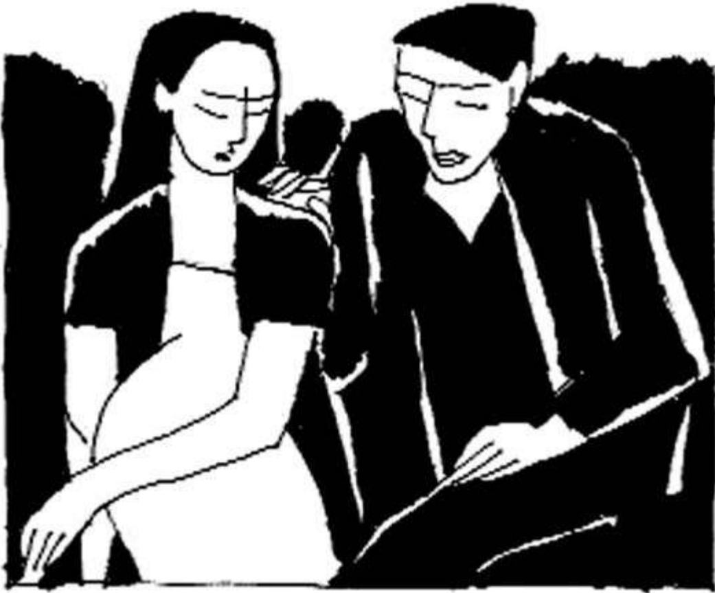
Minh họa: Phạm Minh Hải

viên những đêm trăng rằm... Bây giờ anh sắp có nó, đứa con anh thụ thai với người đàn bà không phải cô. Tim cô như vỡ vụn, mắt lòa nhòa bởi màn nước mỏng không thể kiềm chế. Nợ đời, trớ trêu. Cô quyết định lên quê Huệ. Hai người ngò ì đối diện, nhìn vào vòng bụng to tròn sau lớp áo khoác gió của Huệ, cô chậm rãi: