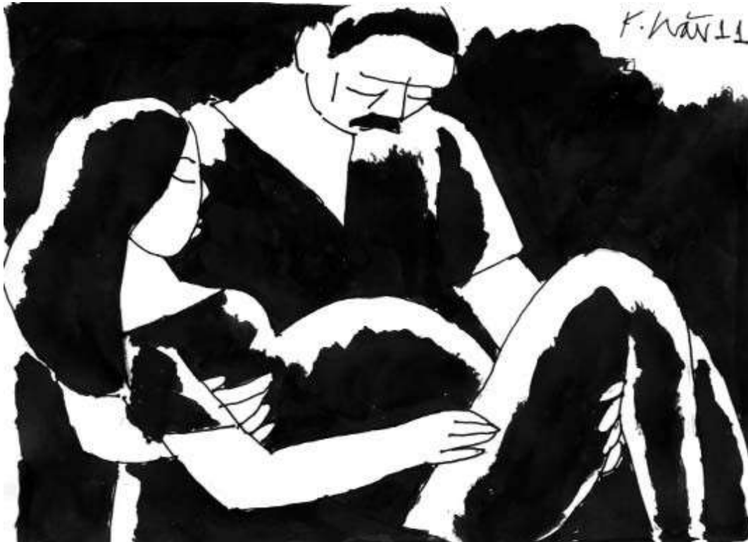
Minh họa: Phạm Minh Hải

Cô chuyển dạ cũng vào một cơn mưa giao mùa tằm tã. Màn trời bị xé tan hoang bởi những tia chớp lòe sáng lóe. Còn da thịt cô xé tung trong những cơn đau. Ông đợi mưa từ chuồng cừ vào, hoảng hốt bỏ nhào tới vì thấy cô lăn lộn trên thềm đất. Trên con đường óng suốt màu cỏ, xối xả mưa, ông bậm từng ngón chân suốt lớp sình nhão nhoẹt ẩm cô ra trạm xá.