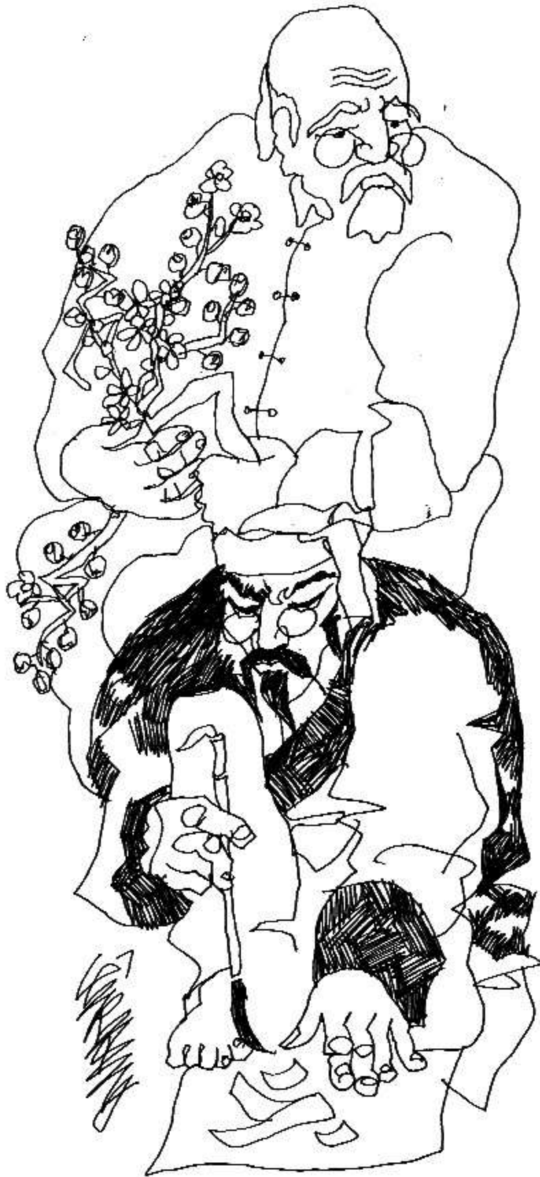
Minh họa: Lê Trí Dũng