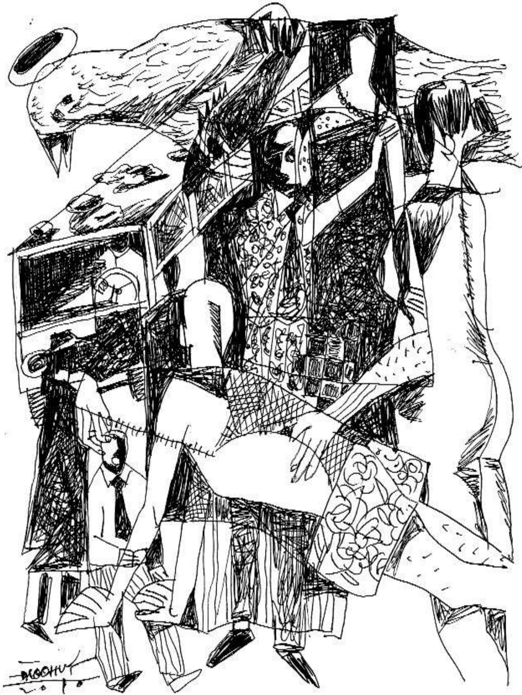
Minh họa: Đào Quốc Huy

Ra khỏi ga tôi bắt xe bus vào thị trấn. Lên cùng với tôi còn có người phụ nữ màu trắng. Trên xe không có ai. Hẳn giờ này mọi người đang ngủ ở nơi nào đó tránh nóng. Đàn ông nhâm nhi một li bia, phụ nữ là sinh tố hoa quả, trẻ con là kem vani.