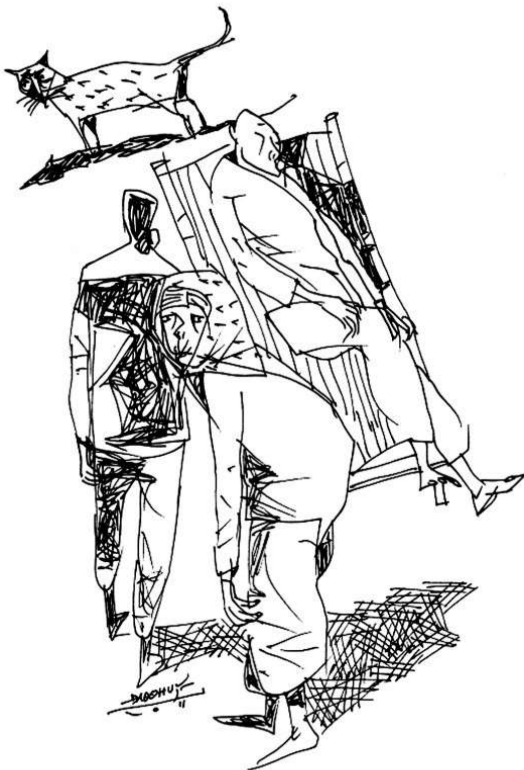
Minh họa: Đào Quốc Huy

Có tiếng động sột soạt phía bụi tre. Bà trộm mừng. Người ta muốn tạo bất ngờ cho bà ư. Anh ngỡ lời, biết đâu anh sẽ nói