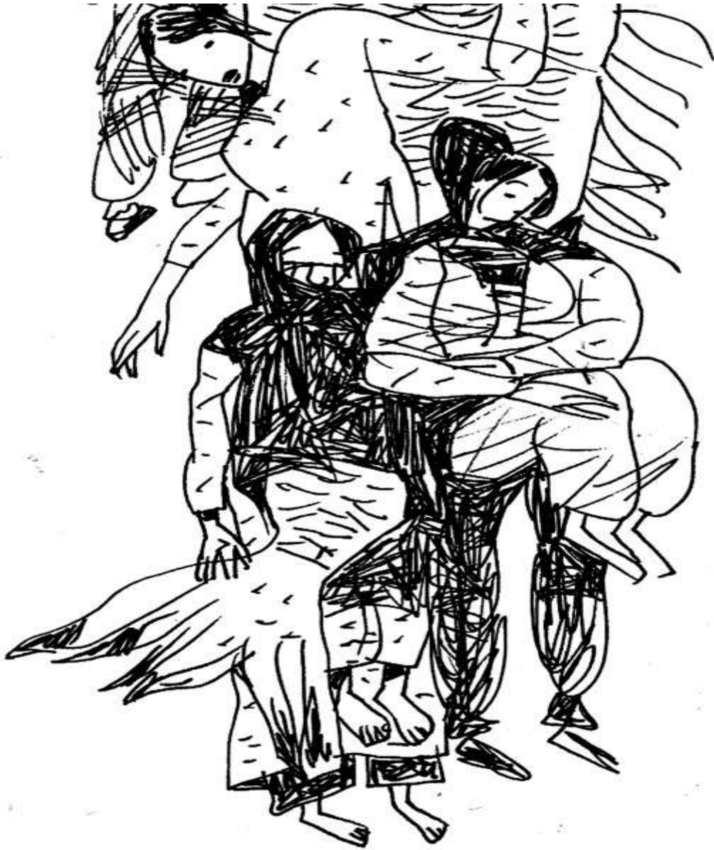
Minh họa: Đào Quốc Huy