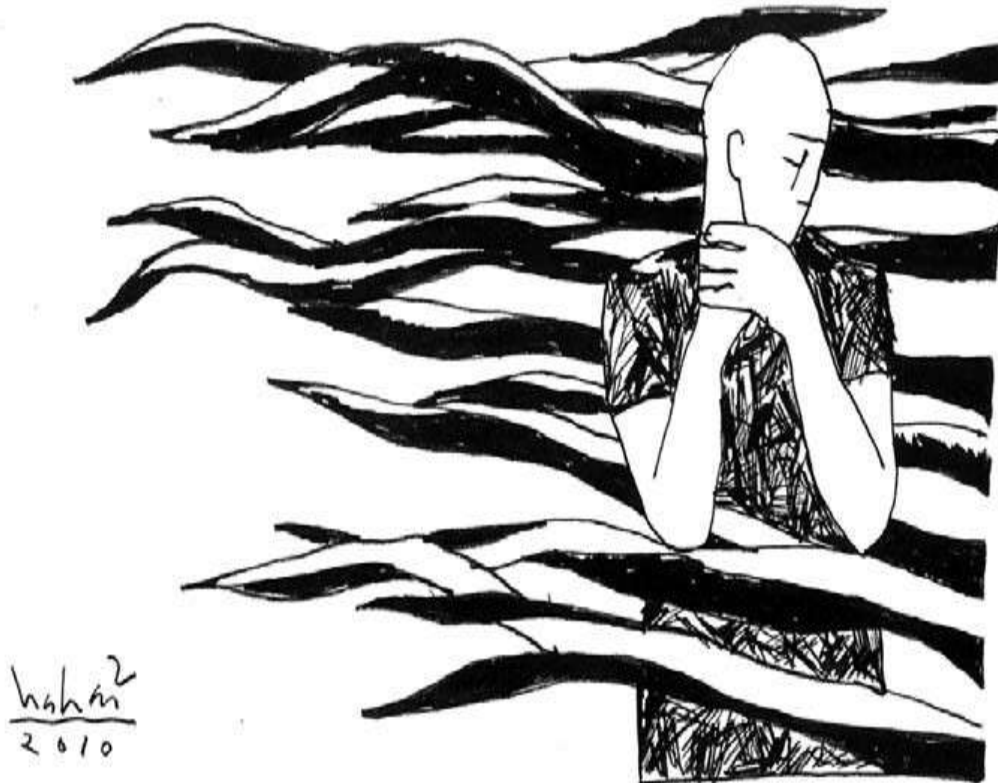
Minh họa: Phạm Hà Hải

- Mọi người im lặng, muốn biết đó là bùa gì phải hông? Thật ra đó không phải là bùa gì hết mà là chén thuốc... rầy! Ha... ha...!