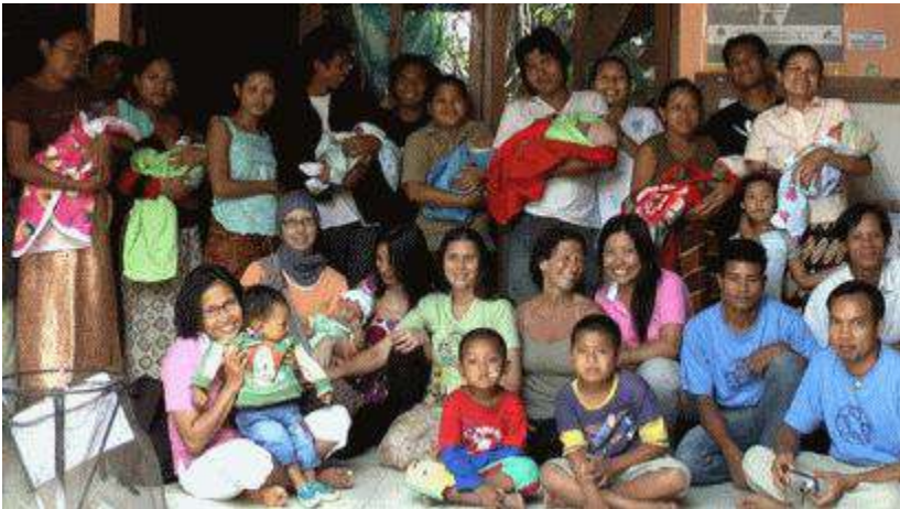
Group shot on an average day at Bumi Sehat Bali

The 7 small babies were all born within 24 hours of the photo