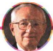
Gordon B. Hinckley

"Tôn trọng bản thân là khởi đầu cho việc nuôi dưỡng tình cảm giữa nam và nữ."