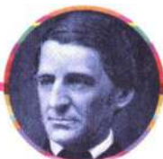
Ralph Waldo Emerson

“Tự lực cánh sinh là nền tảng của phép lịch sự tối thiểu.”