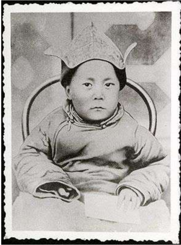
Cậu bé Lhamo Dhondup ở Amdo