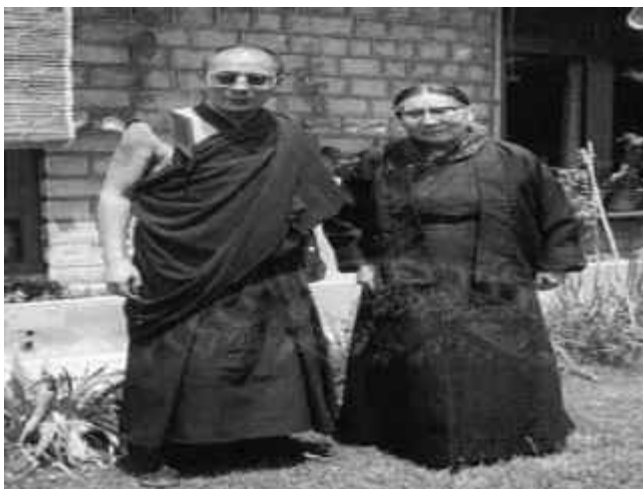
Cụ bà Diki Tsering và Đức Đạt Lai Lạt Ma

Em gái tôi, sau khi tốt nghiệp ở Anh Quốc, đã trở lại Ấn Độ, và cha mẹ chúng tôi nói rằng chúng tôi nên phục vụ chính phủ Tây Tạng bằng cách này hay cách khác, vì thế cô ta nhận một chức vụ tại Thư Viện Hoạt Động và Lưu Trữ của Tây Tạng (the Library of Tibetan Works and Archives) tại Dharamsala. Cô ấy là chủ bút Tạp Chí Tây Tạng (the Tibet Journal) quý vị thấy, đây là một bốn phần trí tuệ. Do thế, khi cô ta ở đây, Bà nội chúng tôi cũng ở đây, và Bà tôi thường gọi cô làm những bữa ăn, và Bà cũng trông cô, như Bà thường trông những đứa con và cháu của Bà. Vì vậy, một ngày nọ, em gái tôi nảy ra ý kiến tuyệt vời này về việc thu thập những câu chuyện về cuộc đời của Bà chúng tôi, vì cô ấy cảm thấy rằng đây là một người đàn bà rất quan trọng, một người phụ nữ với 16 đứa con, và còn trưởng thành bảy người. Nhưng căn bản bởi vì Bà là mẹ của Đức Đạt Lai Lạt Ma. Và khi cô ta đến và tỏ bày ý kiến ấy, Bà Nội chúng tôi rất ngạc nhiên một cách dễ thương.