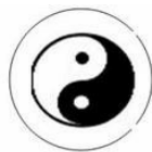
Thái cực đồ

Trong đồ Thái Cực có hai phần bằng nhau : một phần Âm (màu đen) và một phần Dương (màu trắng) bao trong một cái vòng tròn gọi là Đạo (nguyên lý điều hòa và chỉ huy hai lực lượng mâu thuẫn kia).