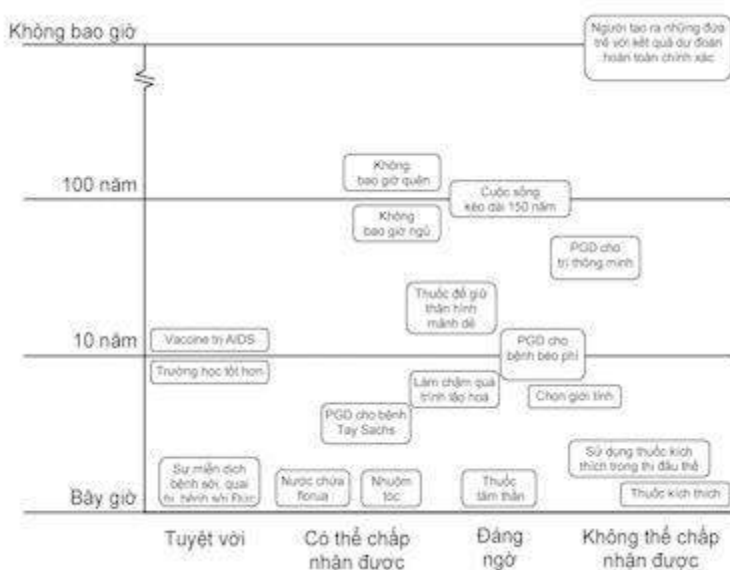
HÌNH A.3. Mô tả đồ họa về nhiều kịch bản hoàn thiện. Trong khi không phải tất cả mọi người đều nhất trí khả năng xảy ra chính xác hay mức độ quan tâm về mặt đạo đức đối với mỗi ví dụ thì biểu đồ này có thể giúp chuyên biệt hóa các tình huống ở góc phần tư bên phải thấp hơn trở thành có tâm quan trọng ngay lập tức.

dụng được nhiều người quan tâm nhất, rơi vào góc phần tư bên phải thấp nhất.