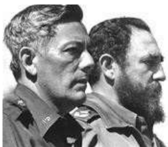
Fidel và tướng panama Omar Torrijos tại Santiago, Cuba ngày 12/01/1976

Cuối tháng mười một, giữa cuộc họp gồm mười ba chủ tịch các trường thành viên của Đại Học Havana và khoảng năm trăm sinh viên ở Phòng Tưởng Niệm Sĩ Tử, Fidel đã bước lên diễn đàn và tố cáo. Ông nêu tên các băng đảng, cảnh sát, lãnh đạo sinh viên hưởng lợi từ “hiệp ước băng đảng” bí mật của Prío. Với bạn bè quen biết trong giới chính trị, ông đã lấy được các thông tin này không mấy khó khăn. Tuy biết đang mạo hiểm mạng sống của chính mình, Fidel lại thấy rằng nhờ đó, ông sẽ được thanh minh mãi mãi trước mọi lời buộc tội ông theo băng đảng và vì vậy, tầm vóc chính trị của ông sẽ tăng. Một hành động dũng cảm có cân nhắc. Tác động bài nói của Fidel thật kinh khủng. Quả nhiên, Fidel vừa nói xong thì xe hơi chở quân vũ trang đã dàn quanh trường đại học.