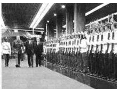
Fidel đang duyệt nghi thức đón tiếp nguyên thủ quốc gia