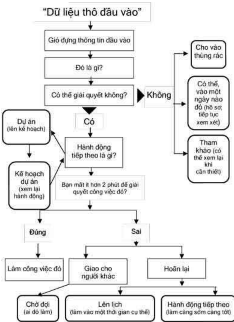
Sơ đồ tổ chức công việc

Trong chương này, tôi sẽ hướng dẫn các bước tổ chức và những công cụ cần thiết khi xử lý thông tin trong hệ thống. Khi bạn bắt đầu xử lý thông tin “bên trong”, bạn sẽ tạo ra các danh sách và nhóm thông tin bạn muốn sắp xếp và bạn sẽ thay đổi suy nghĩ về những thứ có thể bổ sung vào. Nói cách khác, hệ thống tổ chức công việc của bạn không nhất thiết phải được tạo ra trong một lần. Nó sẽ thay đổi khi bạn xử lý các dữ liệu và kiểm tra xem bạn đã để mọi thứ vào vị trí tốt nhất đối với mình chưa?