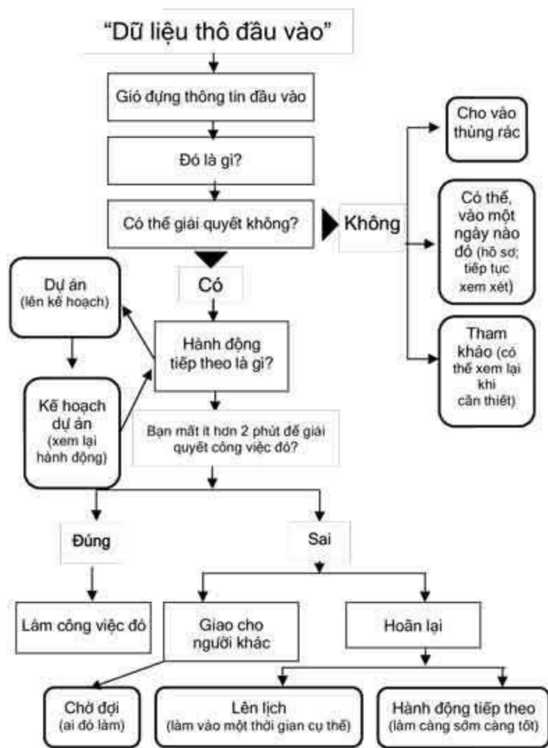
Sơ đồ tổ chức công việc

hồ sơ vào ngày cuối tuần), bạn phải kiểm tra các hồ sơ cho những ngày bạn không có ở đó trước khi đi.