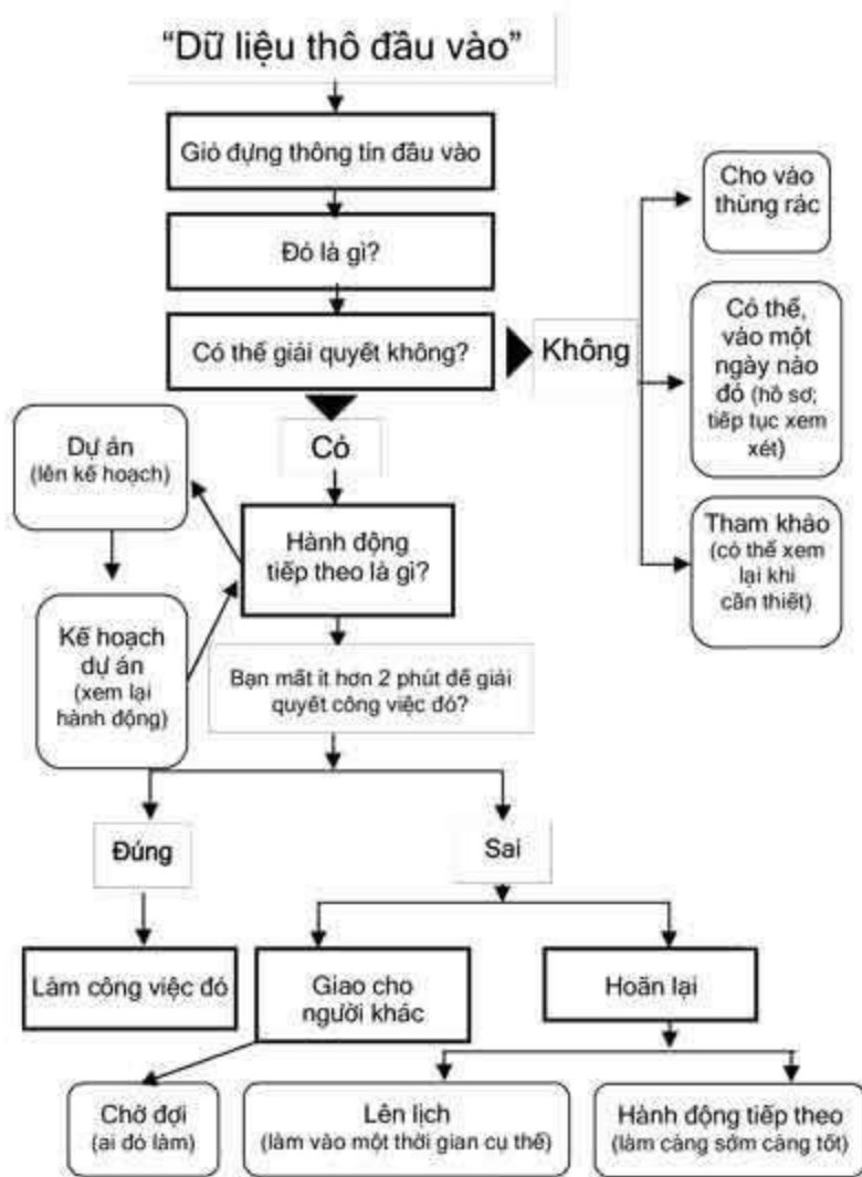
Sơ đồ tổ chức công việc

hiệu quả cho từng công việc. Ví dụ, nếu bạn lấy một thứ từ hệ thống thông tin và nhận ra: “Mình phải gọi điện cho Andrea thông báo về việc đó, nhưng phải gọi vào thứ hai khi cô ấy ở văn phòng”. Sau đó, bạn sẽ hoãn lại việc này và ghi vào cuốn lịch sẽ gọi cho Andrea vào thứ hai.