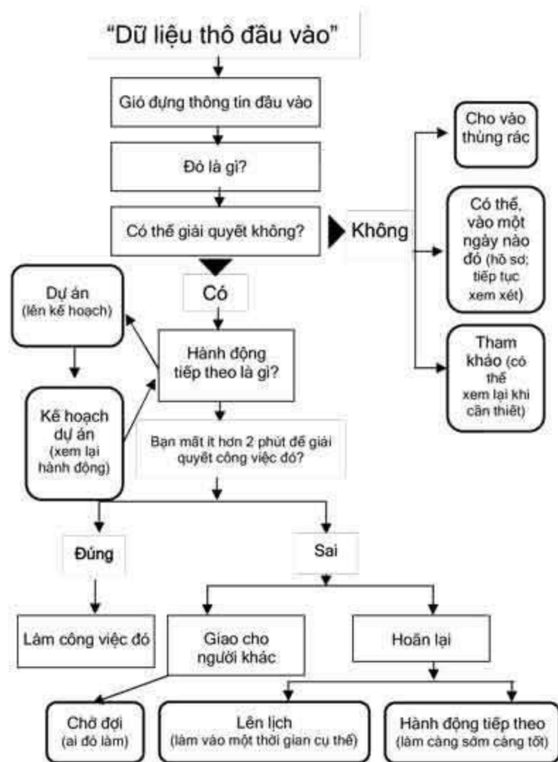
Sơ đồ tổ chức công việc

có thể là danh sách trong cuốn sổ, trong chương trình máy tính hoặc thậm chí là kẹp đựng hồ sơ lưu trữ tờ giấy cho từng công việc. Ví dụ, danh sách công việc hiện tại có thể được lưu trữ ở chương trình Day Runner, hay trong nhóm “công việc phải làm” trên thiết bị kỹ thuật số cá nhân PDA hoặc có thể lưu trữ trong hồ sơ dán nhãn “danh sách công việc”. Những phương tiện nhắc việc được định sẵn (như “Sau ngày mừng một tháng ba phải liên lạc với kế toán để tổ chức một cuộc họp”) có thể lưu giữ trong một bộ hồ sơ trên giấy hoặc máy tính.