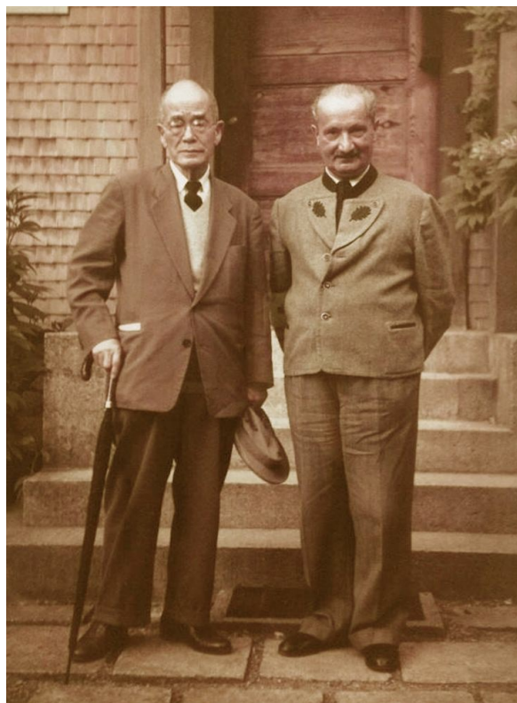
Suzuki và Heidegger

thứ vị trong Phật giáo. Năm 1958, Suzuki thêm vào sách ấy những điểm đáng chú ý về Thiền. Lần hồi với thời gian, Thiền được đặt ngang hàng với Phật giáo Nhật bởi vì, đối với người ngoại quốc ngày nay, Thiền được xem gần như là “tinh hoa của nền văn hóa tế nhị nhất của người Nhật”, như Sir George Sansom đã nói. Vì lẽ này, khi tái bản có hiệu chính, tên của sách được đổi lại là Zen and Japanese Buddhism 41 . Tôi xin ghi điều này: đứng ra trình bày Thiền cho Tây phương, tiến sĩ Suzuki đã trở thành người diễn đạt tư tưởng Nhật lỗi lạc nhất. Vì trong các tác phẩm của ông, chẳng những Đại sư giảng giải về Thiền, mà còn cho độc giả một cái nhìn tổng quát về những điểm đặc sắc nhất của nền văn hóa, mỹ nghệ và thủ công, và về những cái đặc biệt, độc đáo của dân tộc Nhật, như kiếm thuật, thủy mặc, bút thảo, trà đạo và thuật cắm hoa. Trong lối trình bày này, những cái xảo thuật còn con của Nhật đã trở thành như đồng nghĩa với Thiền, nhất là sau khi Suzuki cho xuất bản cuốn Zen Buddhism and Its influence on Japanese Culture 42 — có lẽ đây là tác phẩm lỗi cuốn nhất của Đại sư, đối với phần đông độc giả. Cuốn sách này được Hội Phật Học Đông Phương ở Kyoto ấn hành lần đầu tiên năm 1938. Về sau, sách ấy được điều chỉnh và tái bản trở thành cuốn Zen and Japanese Culture 43 .