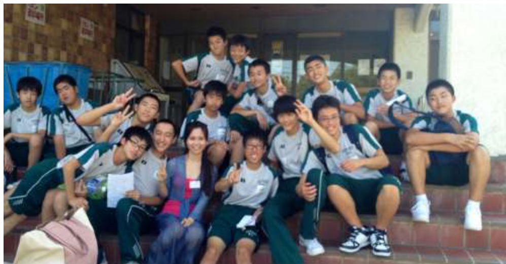
Tác giả tham gia trại hè dạy tiếng Anh cho học sinh một trường cấp hai ở Nhật

Nếu bạn thu mình lại trong vỏ ốc của sự nhút nhát thì cuộc sống du học sẽ là một cực hình. Vạn sự khởi đầu nan, hãy từng bước hòa nhập bằng cách chào hỏi và mở lời với tất cả những người xung quanh bạn.