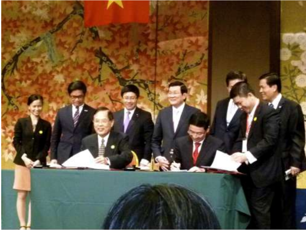
Tác giả trong một lần phiên dịch tại Kansai-Vietnam Business Forum khi chủ tịch nước Trương Tấn Sang sang thăm Nhật Bản