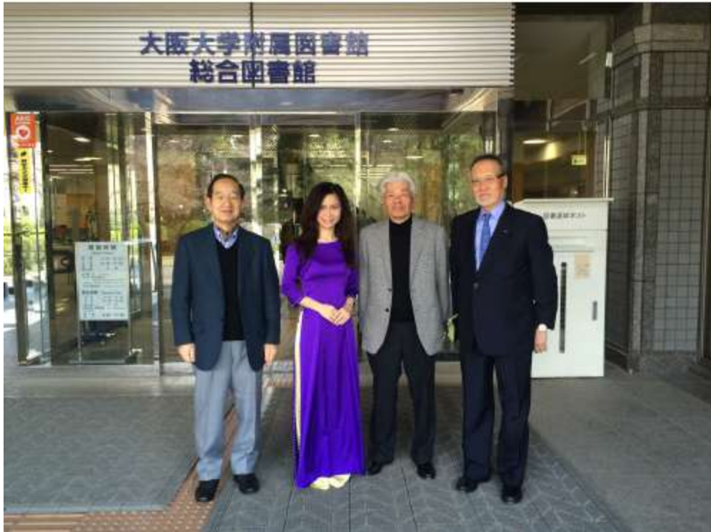
Ảnh chụp trước thư viện trường Đại học Osaka vào ngày tác giả tốt nghiệp thạc sĩ