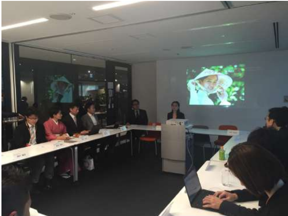
Tác giả giới thiệu về cơ hội đầu tư vào Việt Nam cho các doanh nhân trẻ Osaka

Sau buổi đầu tiên ấy, mọi người truyền tai nhau, rất nhiều người mời tôi đến diễn thuyết về cơ hội đầu tư ở Việt Nam. Trong đó phải kể đến những lần diễn thuyết cho các giám đốc trẻ ở Osaka hay lần diễn thuyết tại trung tâm nuôi dưỡng các doanh nghiệp Osaka (Osaka Knowledge capital), hay câu lạc bộ doanh nhân uy tín Rotary ở Osaka và Nara. Mỗi buổi diễn thuyết trung bình có từ 25 đến 30 người tham gia. Tôi được nghe rất nhiều về thực trạng và hoàn cảnh của các doanh nghiệp. Có những doanh nghiệp đang kinh doanh kém hiệu quả ở Việt Nam và có những doanh nghiệp đang tìm cơ hội đầu tư tại Việt Nam. Trả lời những câu hỏi của họ và giúp đỡ họ tìm ra lời giải cho các vấn đề liên quan đến Việt Nam khá mất thời gian vì đầu tiên phải tìm hiểu, sau đó là phân tích rõ ràng mới bàn bạc và giúp đỡ họ. Tuy nhiên, qua những công việc như vậy tôi cũng học được nhiều hơn về kinh doanh và có mối quan hệ rất tốt với họ. Họ luôn tạo điều kiện để giúp đỡ và trả lễ cho tôi.