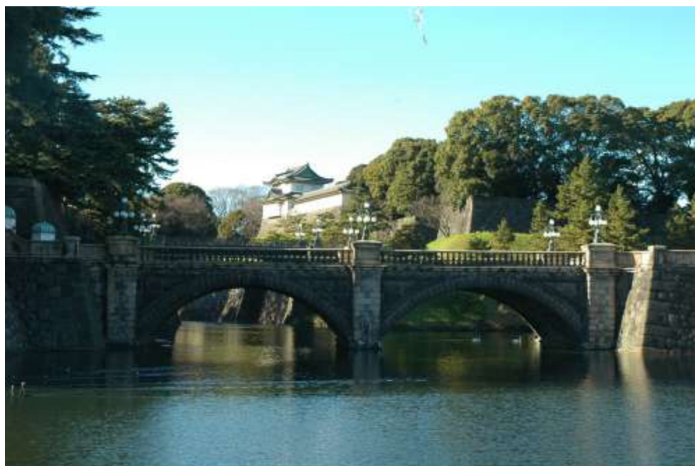
Cầu Nijubashi trong khuôn viên hoàng cung.

giữa những ngôi nhà chọc trời, trong khuôn viên một khu vườn rộng nhiều cây lớn, hoa và hồ nước, một phần hoàng cung Nhật được mở cửa cho du khách tham quan. Gần hoàng cung là khu kinh tế tài chính Marunouchi – nơi tập trung rất nhiều trụ sở chính của các tập đoàn lớn của Nhật và nước ngoài. Mọi thứ ở đây luôn đẹp trong sự tỉ mỉ và không chút lộn xộn. Con người đến đây cũng chủ yếu là vì công việc hay thăm quan chứ ít khi để tụ tập vui chơi. Khu vực Marunouchi là nơi mà khi đến bạn sẽ cảm nhận được sự lịch lãm trong vẻ ngoài rất bận rộn của Tokyo với các cửa hàng đồ hiệu sang trọng, những ghế gỗ hai bên đường đi bộ, bên cạnh là các cửa hàng nội thất đẹp mắt. Lần đầu tiên bước vào khu này, tôi không thể nghĩ sau này mình sẽ được làm việc tại đây. Chính vì lẽ đó tôi luôn cảm thấy trân trọng từng góc phố quanh đây, đặc biệt là con đường đi bộ, nơi được trang trí đèn sáng suốt đêm trong dịp Noel hay năm mới, hai bên đường là các nhà hàng rất đẹp mắt với những món ăn ngon. Đến với khu Marunouchi, ngó lên trên ghế đá nhìn ra Hoàng cung bạn sẽ được tĩnh tâm trong cái bận rộn của công việc.