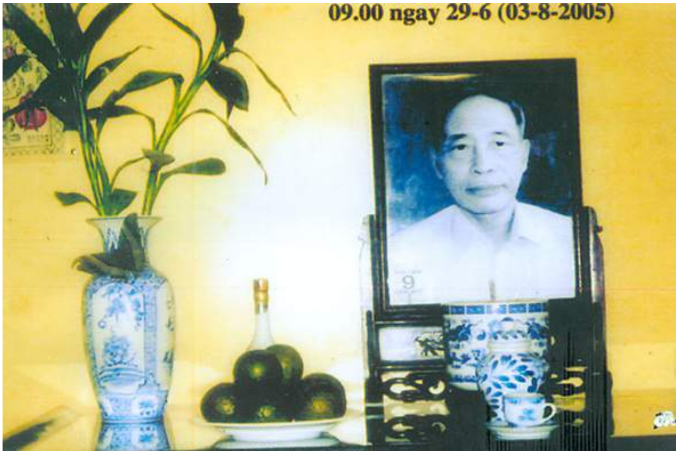
Bướm bay về đậu bàn thờ tướng Trần Độ