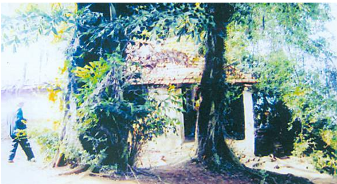
Đền thờ nữ đại tướng Bát Nàn ở Việt Trì, tỉnh Phú Thọ (Trước khi trùng tu)

Một thời gian sau, theo đề nghị của địa phương, cấp trên cho một phần kinh phí, nhân dân đóng góp một phần để trùng tu. Thế là nảy sinh ra hai loại ý kiến, không thể khởi công được. Một bên là giao cho các nhà thầu. Một bên là các cụ hội người cao tuổi sợ tiền ít mà thất thoát tiêu cực thì không xong, nên các cụ muốn được trực tiếp nhận trách nhiệm trùng tu. Trong khi đang tranh cãi, một con rắn trắng xuất hiện nằm tại đền, mưa nắng, ngày đêm không đi đâu. Dân làng nấu xôi, gà ra cúng, lấy ô ra che mưa che nắng... Cả chủ thầu và toán thợ sợ quá bỏ đi. Sau đó, được chính quyền giúp đỡ, các cụ hội người cao tuổi đảm nhiệm - rắn đi. Chúng tôi lại đến khảo sát, miếu thờ đã được xây dựng khang trang, có tiền sảnh, minh đường rất đẹp. Thỉnh thoảng rắn vẫn đi qua cửa đền.