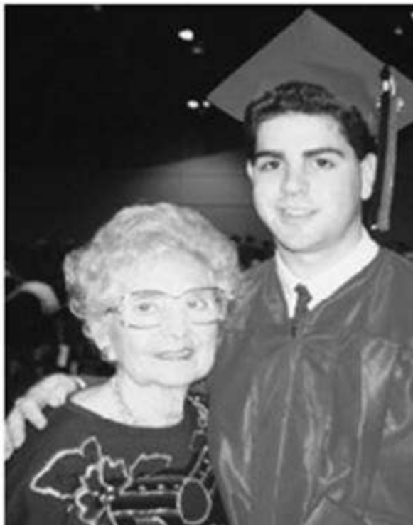
Bà ngoại Dodo đáng kính và tôi tại lễ tốt nghiệp phổ thông trung học.