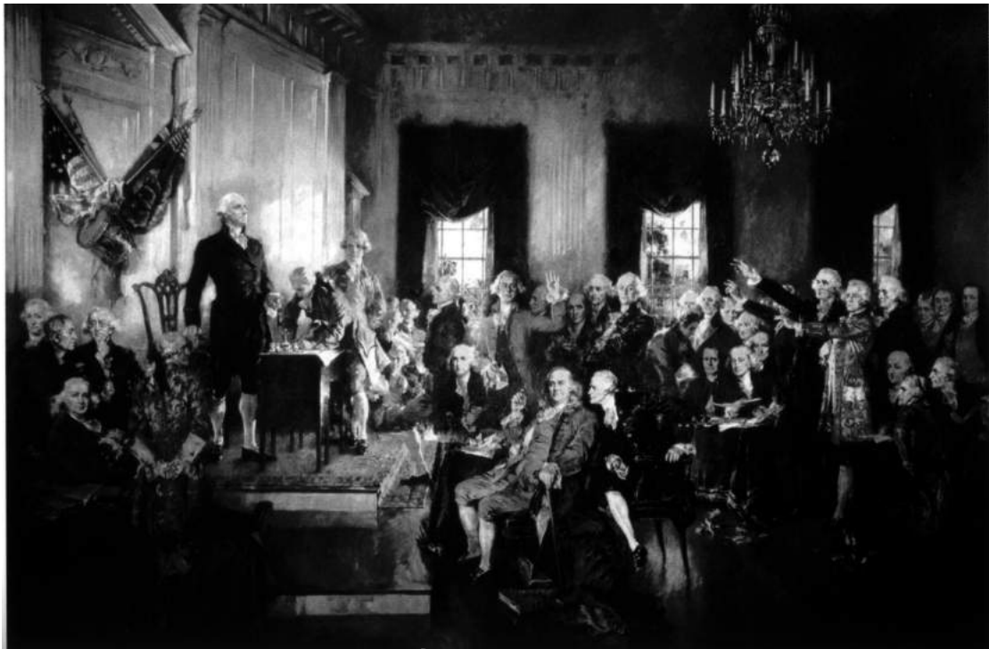
Quang cảnh buổi ký kết Hiến pháp Hoa Kỳ

Nhưng, làm cách nào để bạn có thể tạo ra những tấm thẻ " bit " thông minh?