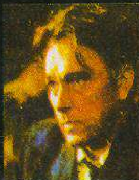
RICHARD BURTON as Leonidas