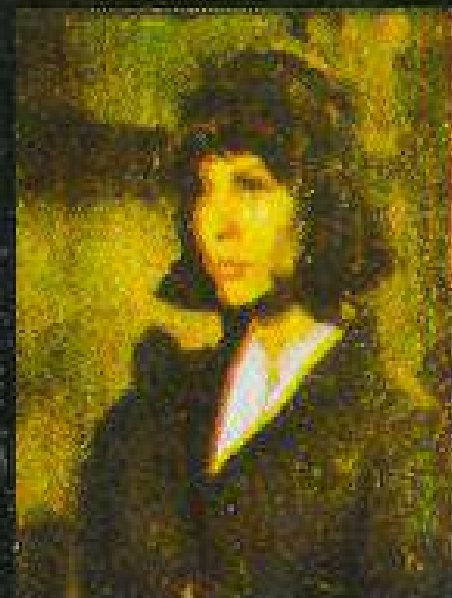
CLAIRE BLOOM as Liz