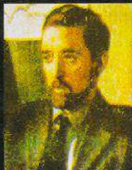
OSKAR WERNER as Friedler