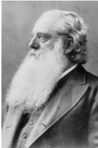
HENRY STEEL OLCOTT 1832 – 1907

“Lời thệ nguyện một khi được đưa ra, thì mãi mãi được ràng buộc vào cả hai cõi giới đạo đức lẫn huyền linh. Nếu chúng ta vi phạm nó một lần và bị trừng phạt thì điều đó không chứng minh chúng ta có lý khi vi phạm nó một lần nữa, và chừng nào mà chúng ta còn vi phạm, thì chừng đó cái đòn bẩy mạnh mẽ của Định luật (Nghịệp Quả) sẽ tác động vào chúng ta”. (Tạp Chí Thánh Đạo, tháng 7-1889).