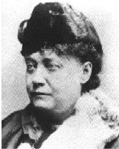
Helena Petrovna Blavatsky