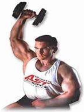
Một tay nhấc tạ qua đầu

Thực hiện động tác tập một cách tự nhiên trong toàn bài tập sẽ tạo cho bạn nhiều năng lượng hơn. Theo tôi thì nên nắm thanh tạ gắn vào cáp với ngón tay cái ở phía trên. Tôi thích sự thoải mái ở cổ tay và tôi tin rằng có thể nâng được tạ nặng hơn với cách nắm tạ này. Khi tập đúng thì bài tập này sẽ rất tốt để tăng sức