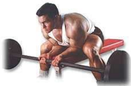
Cuốn tạ đòn ở cổ tay

Nếu bạn tập đúng thì sẽ tăng tác động rất tốt của tạ lên cơ bắp. Trên thực tế, tập một bên tay với cùng một thời gian sẽ tốn mất hai lần năng lượng. Hiệu quả sẽ kém hơn khi tập phối hợp hai tay cho cơ tam đầu bắp tay sau.