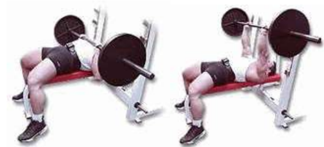
Nằm trên ghế đẩy tạ với hai tay gần nhau

Bài tập dùng một tay nhắc tạ giơ thẳng qua đầu không phải là bài tập hiệu quả nhất cho cơ tam đầu bắp tay sau. Bạn không lấy đủ trọng lượng cần thiết nếu chỉ dùng một cánh tay. Hơn nữa, bạn sẽ phải mất năng lượng gấp hai lần mà trọng lượng của tạ nhỏ hơn.