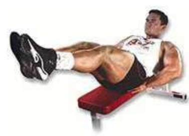
Nằm trên ghế nâng