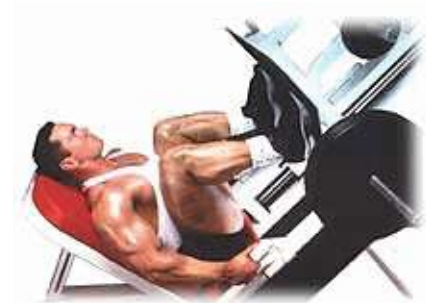
Nằm giá đạp

Nếu muốn cơ thể mình được vững chãi, tôi thấy mình có thể đeo đai thắt lưng và miếng quần đầu gối.