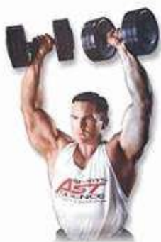
Bài tập ngồi đẩy tạ đòn nâng thẳng qua đầu

Có thể tập ở trước và sau cổ. Tập bài này sau cổ thì sẽ tạo những lực không tốt cho khớp vai. Tôi thấy tập bài này ở phía trước rất có lợi. Nó gây ít sức ép lên khớp vai và bạn có thể nâng tạ nặng hơn trong khi phạm vi di chuyển sẽ lớn hơn.